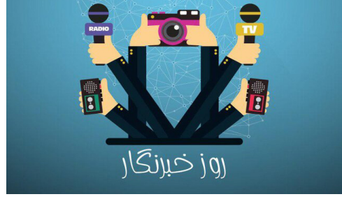
مدیرکل پشتیبانی امور دام خوزستان: خبرنگاران و اعضای خانه مطبوعات می‌توانند از طریق خانه مطبوعات از این هدیه بهره‌مند شوند.

۳۱۴ میلیون ریال به‌ عنوان هدیه روز خبرنگار به خانه مطبوعات خوزستان اختصاص یافت.